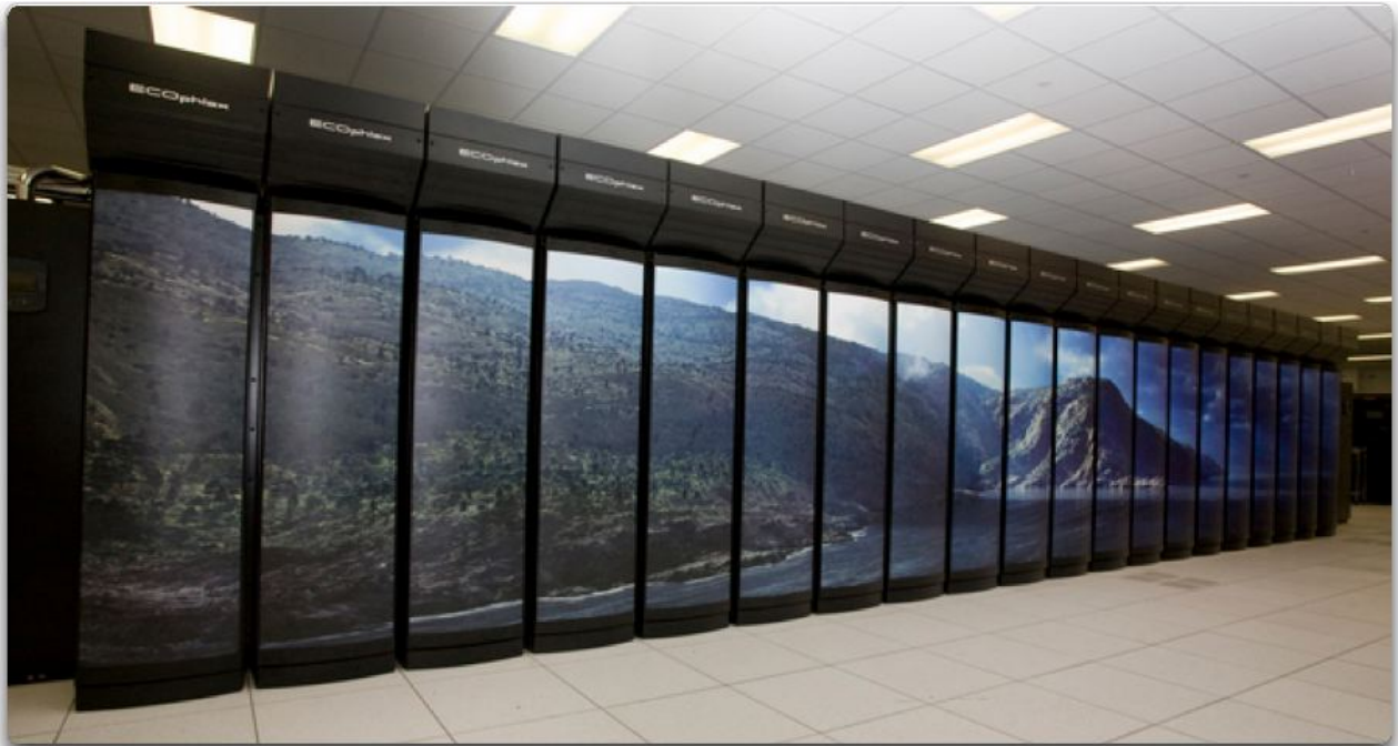
Abbildung: Der Cray ecoplex NOAA GAEA Supercomputer, der für die Modellierung verwendet wird. Gaea wurde durch eine Investition in Höhe von 73 Millionen Dollar im Rahmen des American Reinvestment and Recovery Act von 2009 durch eine gemeinsame Partnerschaft zwischen der NOAA und dem Energieministerium finanziert.

Also nahm ich mir das GISS-Modell vor, um zu sehen, was ich finden kann. Von einer Reise, die ich vor zwei Jahrzehnten durch den MuddleE-Code unternommen hatte, wusste ich, dass es Probleme mit „Schmelzbecken“ gab. Das sind die Schmelzwasserbecken, die sich auf dem saisonalen Meereis bilden. Sie sind wichtig für die Berechnung der Albedo des Meereises. Auf meiner letzten Reise hatte ich festgestellt, dass die Tage, an denen sich Schmelztümpel bilden konnten, zeitlich stark begrenzt waren.